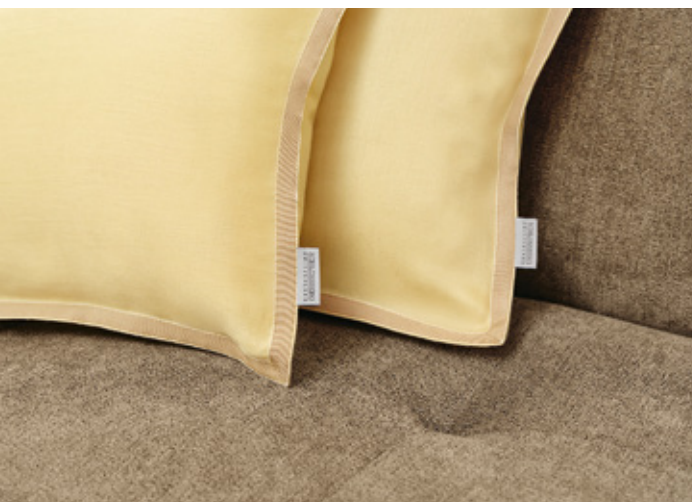
Zierkissen / Decorative cushion SOLENE sun