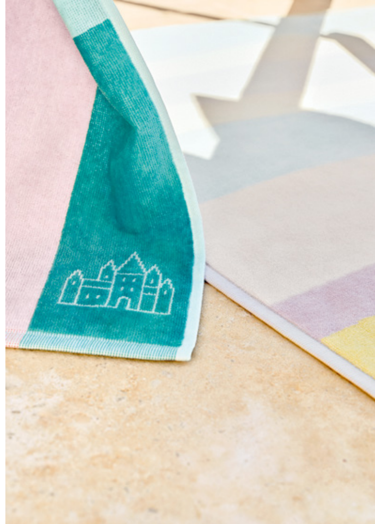
Strandtuch / Beach towel SUMMER multicolor

Our personal favorite companions for a relaxing short break in your own summer garden or for an upcoming Mediterranean vacation: with the fluffy soft velour terry, they are guaranteed to become indispensable must-haves.