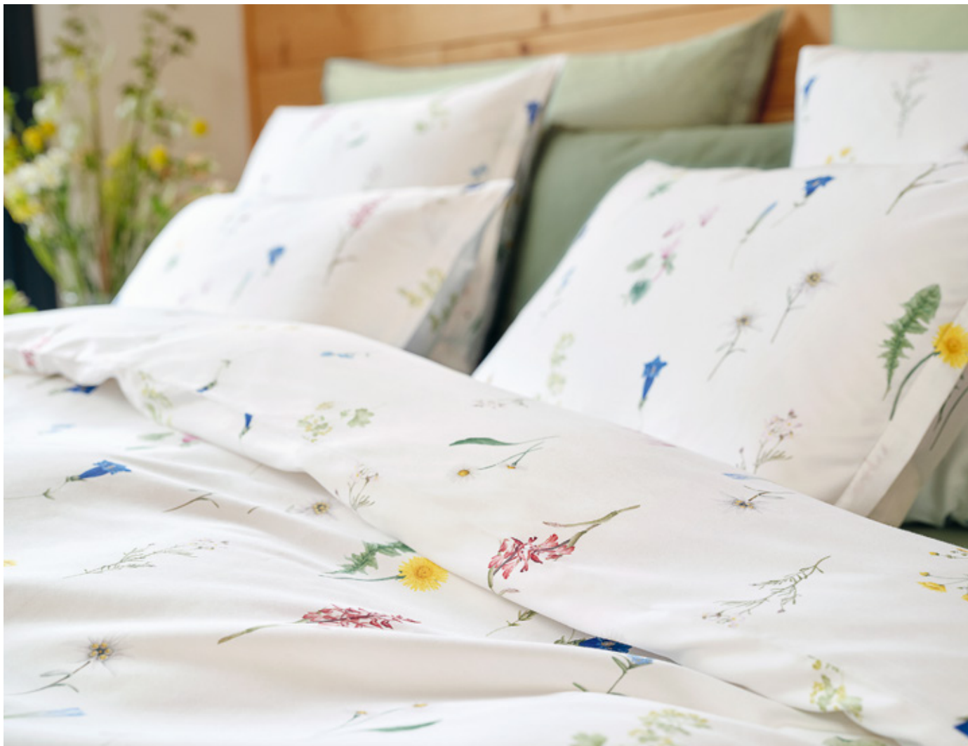
FLURINA blanc | UNI palmier – thyme

Technik / Technique: Aquarell / Watercolor