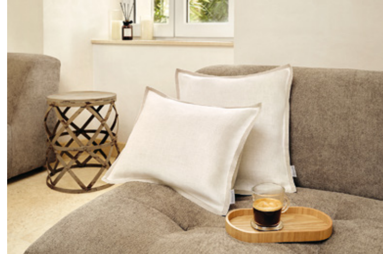
Zierkissen / Decorative cushion SOLENE sand

Sun on your skin, feelings of happiness in your stomach, the warm seasons are on their way – so let's make it beautiful down to the last detail with the decorative cushions made of high-quality linen sateen: whether as a stylish decorative element with light summer bed linen, for a cozy reading corner or a personal retreat in your own garden, you decide for yourself.