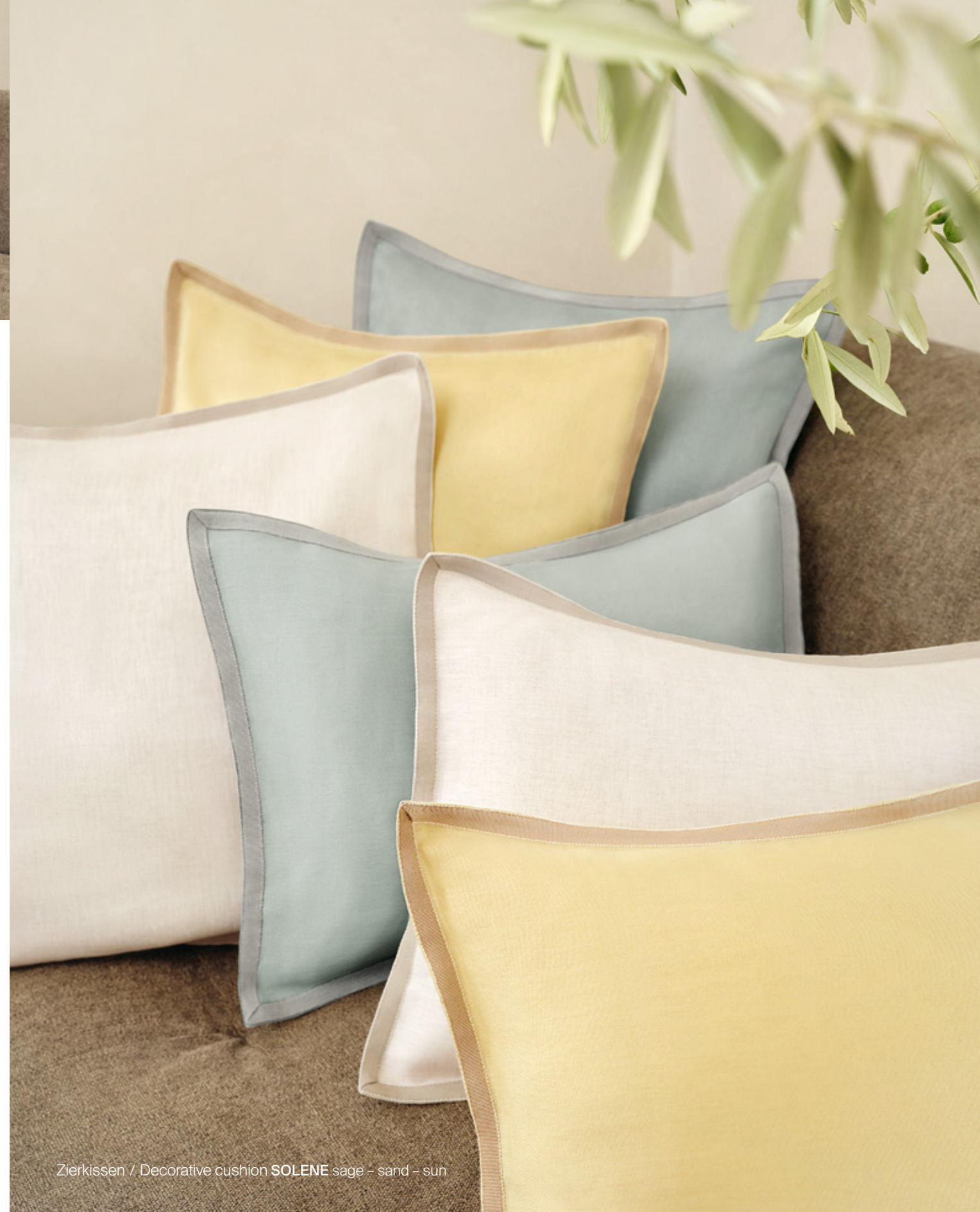
Zierkissen / Decorative cushion SOLENE sage – sand – sun