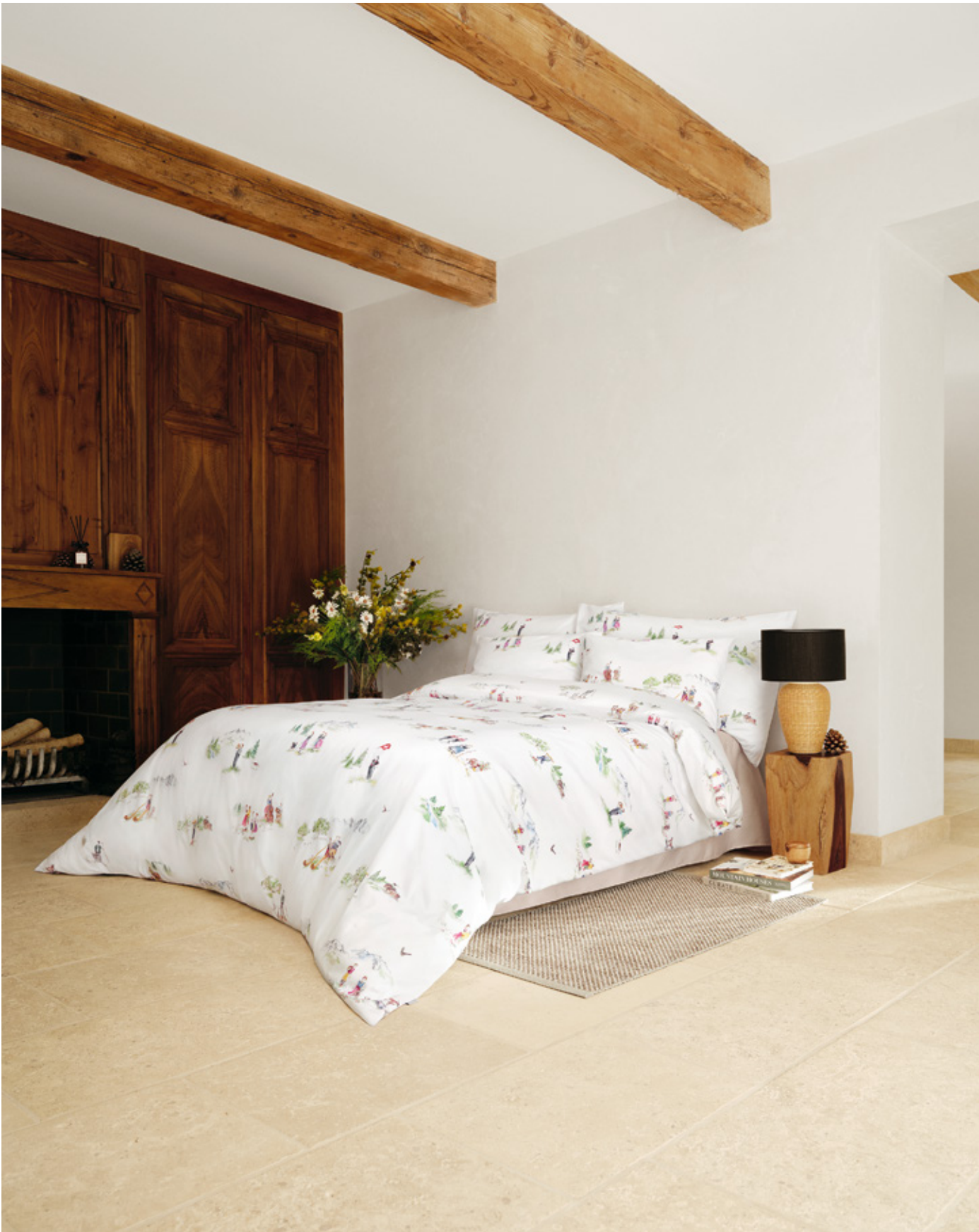
ALMA blanc | UNI perle