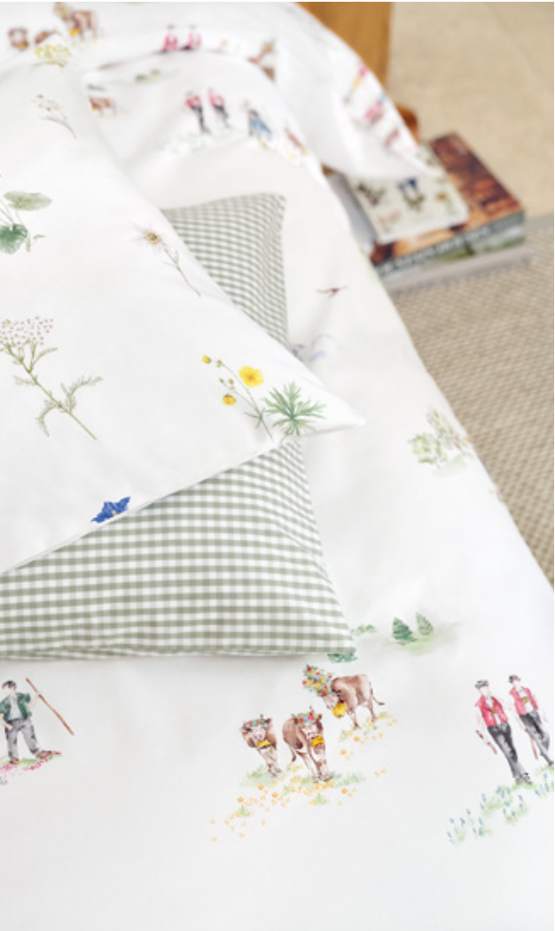
ALMA blanc | ANDRIN vert | FLURINA blanc