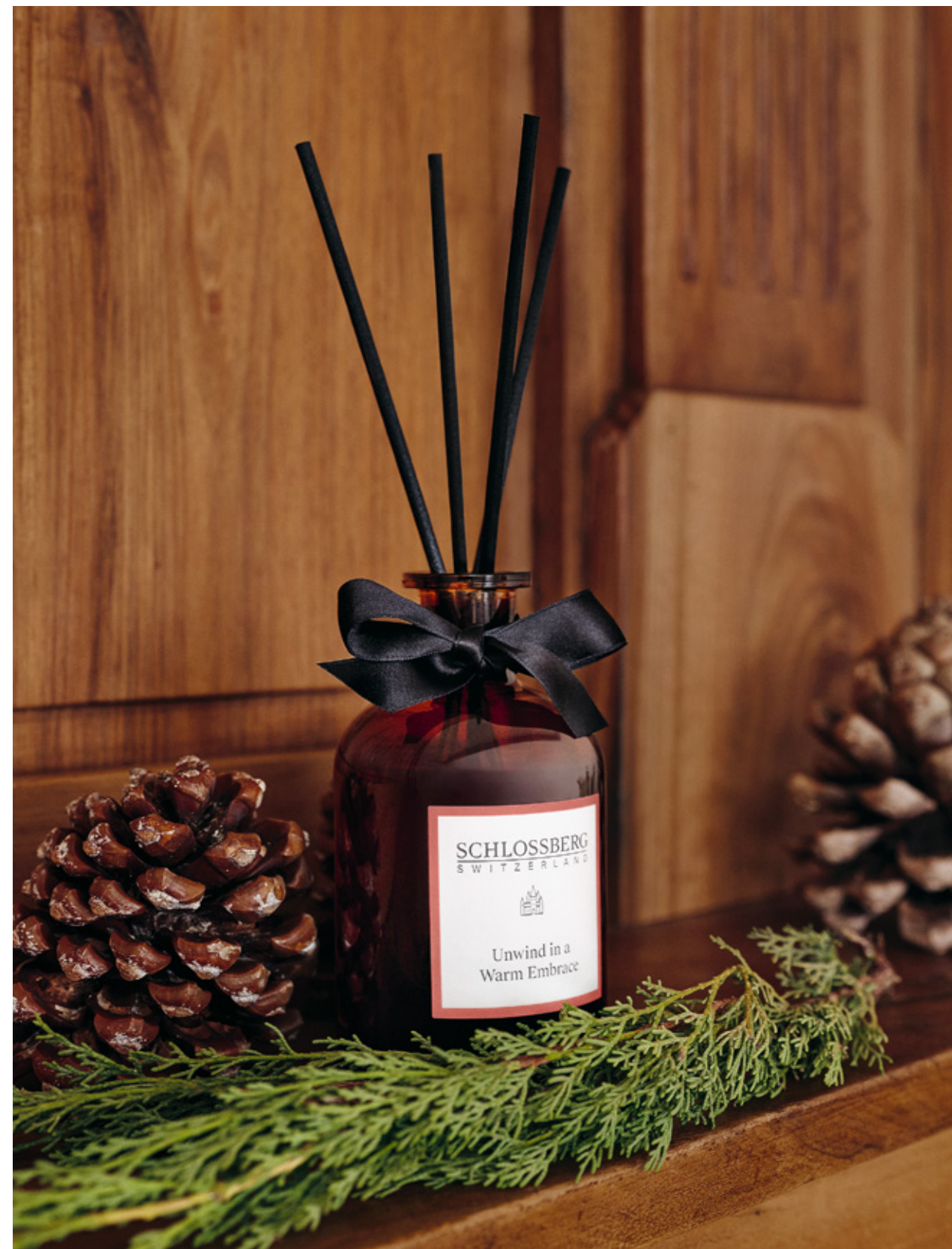
RAUMDUFT / ROOM FRAGRANCE Unwind in a Warm Embrace