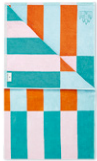
Strandtuch / Beach towel SUMMER multicolor

Erdbeereis und Aperolorange, Poolblau und Türkismeer – wenn schon die Farben so herrlich nach Sommer klingen, dürften die flirrend heißen Strandtage nicht mehr weit sein.