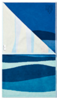
Strandtuch / Beach towel MANOA multicolor